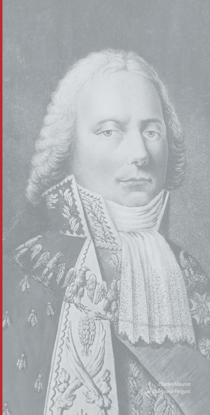
Charles-Maurice de Talleyrand-Périgord